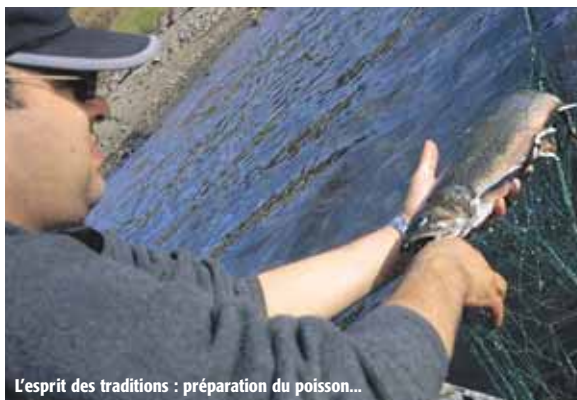
L'esprit des traditions : préparation du poisson...

Puis, on grimpe dans la pierraille en protégeant ses chevilles. Sur les collines,