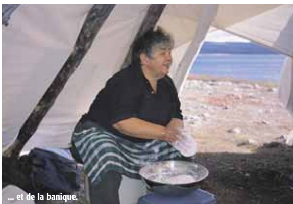
... et de la banique.